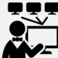
Sauvegarde des données

Un diagnostic rapide des problèmes et intervention sur site dans les 8h.