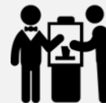
Suivi et conseil