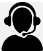
Assistance téléphonique illimitées

Maintenance et télémaintenance des installations informatiques en entreprises. Matériel contrôlé tout au long de l'année. Interventions illimitées.