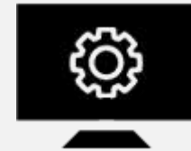
Monitoring 24/24h, 7/7j

Au moins une visite trimestrielle systématique. Assurance du suivi sécurité, optimisations des appareils, maintien du bon fonctionnement.